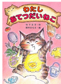
「わたしおてつだいねこ」 竹下文子 文/金の星社

野山でみつけた鳥の巣の造形的魅力にひかれ、独学で収集、研究をはじめ、NHK「ダーウィンが来た!」「プレミアムー8」「視点・論点」などテレビ出演多数。全国各地で、鳥の巣と絵本原画展を開催。